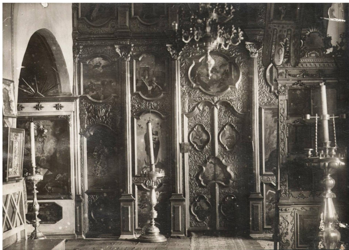
Рис. 6. Внутреннее убранство Крестовоздвиженской церкви, предположительно, перед ее закрытием Государственный архив Иркутской области

Fig. 5. Holy Cross Church, 1940s-50s (?). N.N. Muravyov-Amursky Irkutsk Regional Museum of Local History