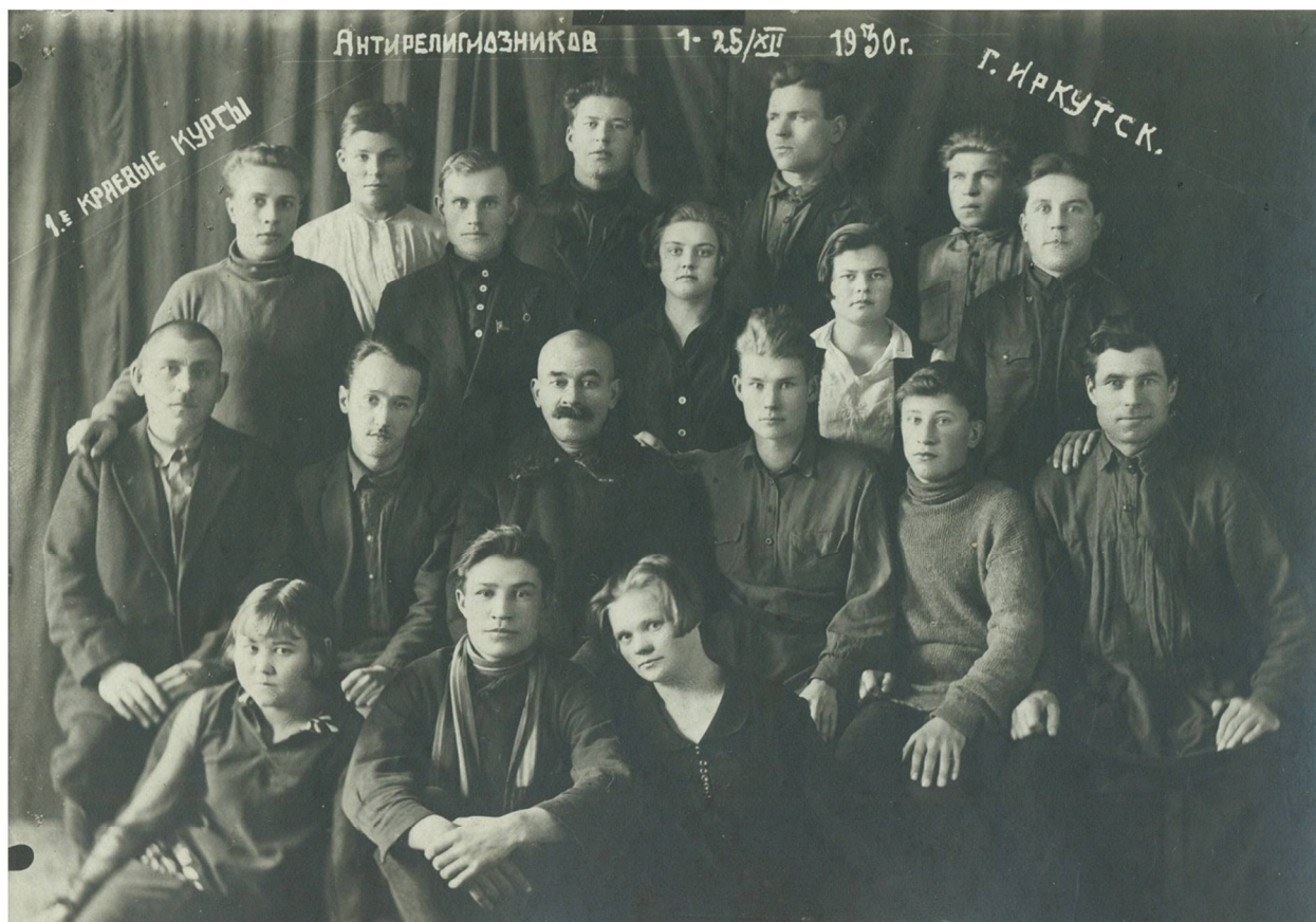
Рис. 4. Участники первых краевых курсов антирелигиозников в г. Иркутске, 1–25 декабря 1930 г. Иркутский областной краеведческий музей им. Н.Н. Муравьева-Амурского. Во 2-м ряду 3-й справа – А.П. Окладников Fig. 4. Participants of the 1st regional anti-religious courses in Irkutsk, December 1-25, 1930. In the N.N. Muravyov-Amursky Irkutsk Regional Museum of Local History. 2nd row of the 3rd right - A.P. Okladnikov

воду одного такого случая община даже писала жалобу в Москву, в Президиум ВЦИК (ГАИО. Ф. Р-504. Оп. 5. Д. 288 (686). Л. 67–67 об.). Городские власти настаивали на необходимости изъятия Крестовоздвиженской церкви (рис. 5.) из пользования общины и переоборудования ее под культурные нужды, так как, по их мнению, община ненадлежащим образом следила за сохранностью церкви, как культурно-исторического памятника высшей категории (ГАИО. Ф. Р-504. Оп. 5. Д. 279. Л. 35). Несмотря на все старания общины отстоять церковь, она была закрыта в 1933 г. (рис. 6.)