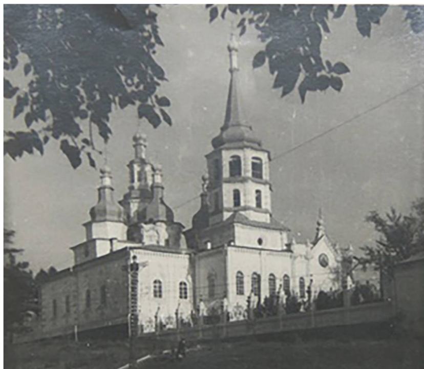
Рис. 5. Крестовоздвиженская церковь, 1940-50-е гг. (?). Иркутский областной краеведческий музей им. Н.Н. Муравьева-Амурского

Fig. 5. Holy Cross Church, 1940s-50s (?). N.N. Muravyov-Amursky Irkutsk Regional Museum of Local History