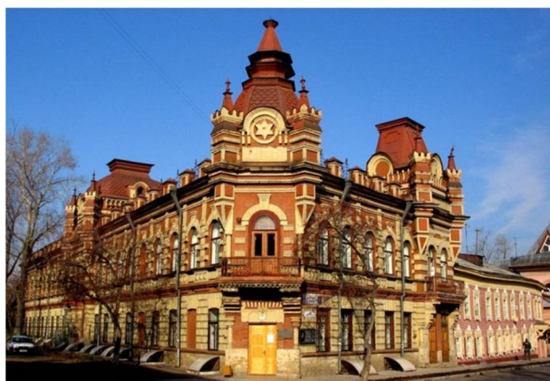
Рис. 1. Дом И.М. Файнберга Fig. 1. I.M. Feinberg House

24 декабря 1930 г. в редакцию газеты Восточно-Сибирская правда было отправлено объявление о том, что «28 декабря... в здании Музея, угол Халтурина и Гусарова... состоится общественный просмотр вновь открывающегося антирелигиозного отдела...» (ГАИО. Ф. Р-47. Оп. 1. Д. 56. Л. 219). Интересно то, что в газете эта информация так и не появилась, поэтому нельзя быть уверенными, что это открытие состоялось. Можно предположить, что антирелигиозный отдел был открыт «вчерне»