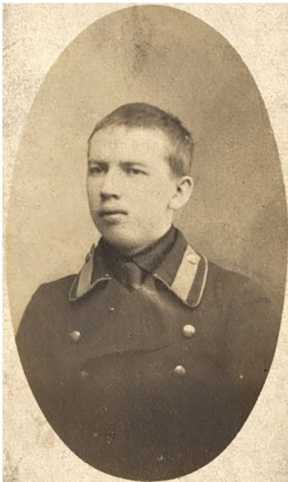
Рис. 9. В.И. Подгорбунский, 1910 г.

22 октября 1935 г. он был принят научным сотрудником в антирелигиозный отдел. В уже упомя-